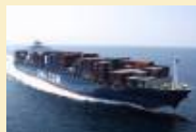
CMA CGM : Nouveau programme de restauration des taux de fret