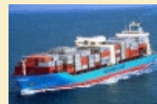
Maersk fournira 5 des 6 navires du service FM3/NEW CIMEX 2