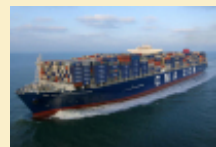
CMA CGM mise toujours sur le gigantisme