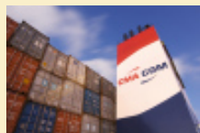
CMA CGM lance un nouveau service entre l'Asie, l'Inde et le Pakistan