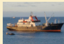
Le Marion Dufresne « sauvé »