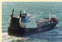
CMA CGM va se séparer du Roland Delmas