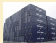
CMA CGM : Les conteneurs sous surveillance