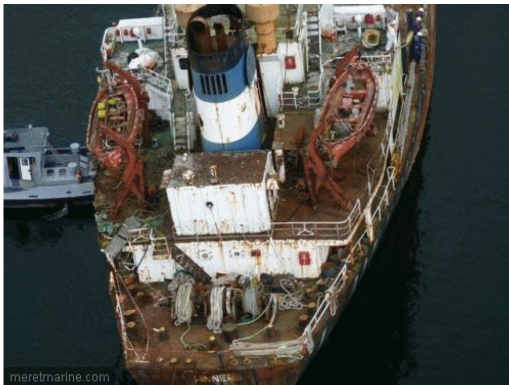
Le Winner, lundi en Penfeld