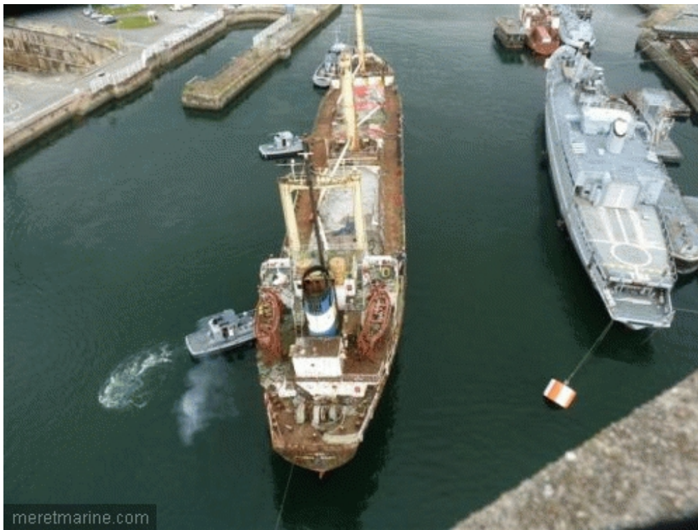
Le Winner, lundi en Penfeld