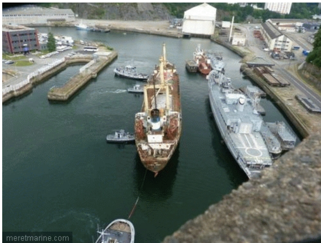
Le Winner, lundi en Penfeld