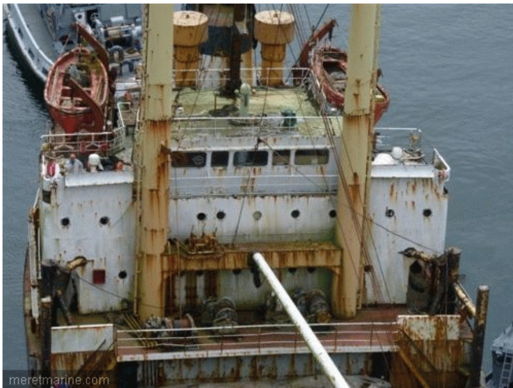
Le Winner, lundi en Penfeld

Arraisonné en 2002 par la Marine nationale avec, à son bord, une importante cargaison de Cocaine, le cargo Winner sera démantelé, à partir du mois de septembre, dans l'un des bassins situé au fond de la Penfeld, à Brest. En attendant, le navire (ou plutôt l'épave) a été déplacé lundi du poste 9 au poste 12, où il a été amarré à couple de l'ex-D'Entrecasteaux. Avant de pouvoir lancer la déconstruction du Winner, l'Etat a été contraint d'attendre durant de nombreuses années la fin des différents procès et recours de l'affaire. Mais, entre temps, les autorités brestoises se sont retrouvées avec un cargo abandonné, dont l'état n'a cessé de se dégrader au fil du temps, posant des problèmes de sécurité.