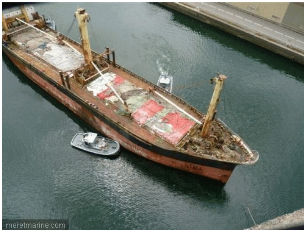
Le Winner, lundi en Penfeld