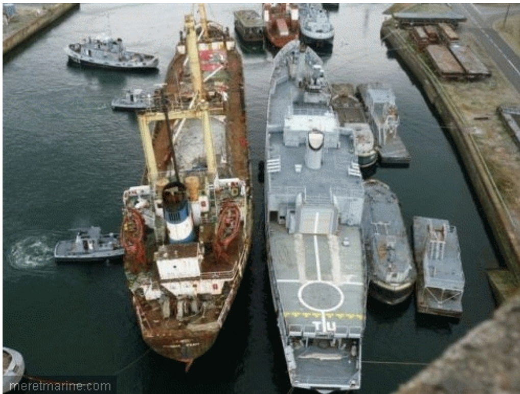
Le Winner, lundi en Penfeld