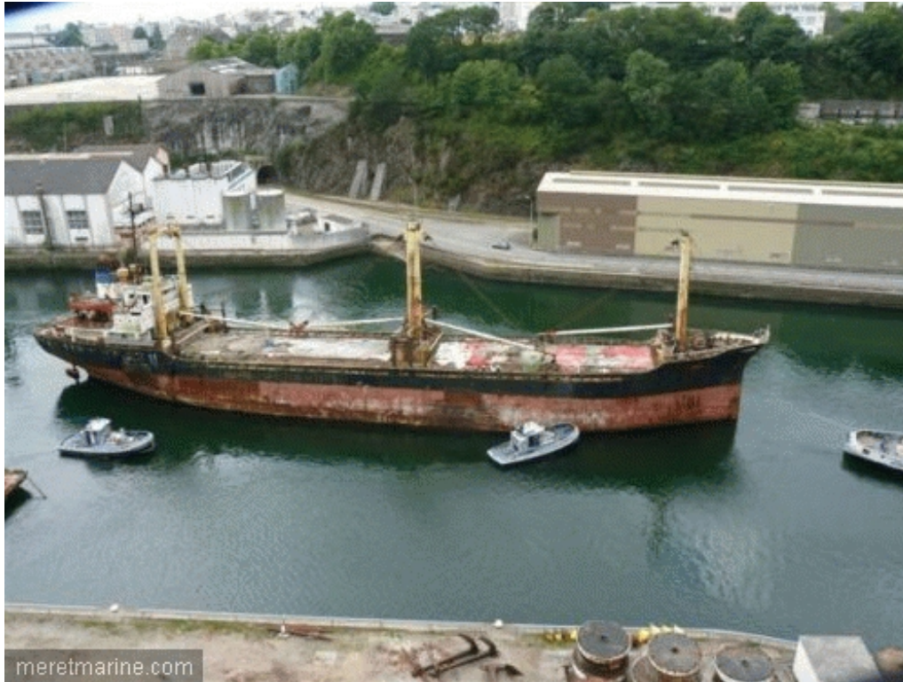
Le Winner, lundi en Penfeld

humains réglés lorsqu'il y en a .... Le fait pour un armateur d'abandonner son navire devrait faire l'objet de poursuites judiciaires, l'Organisation Maritime Internationale et autres organismes devraient imposer des obligations à l'Etat du pavillon et à ces armateurs peu ou pas scrupuleux », estime Mor Glaz.