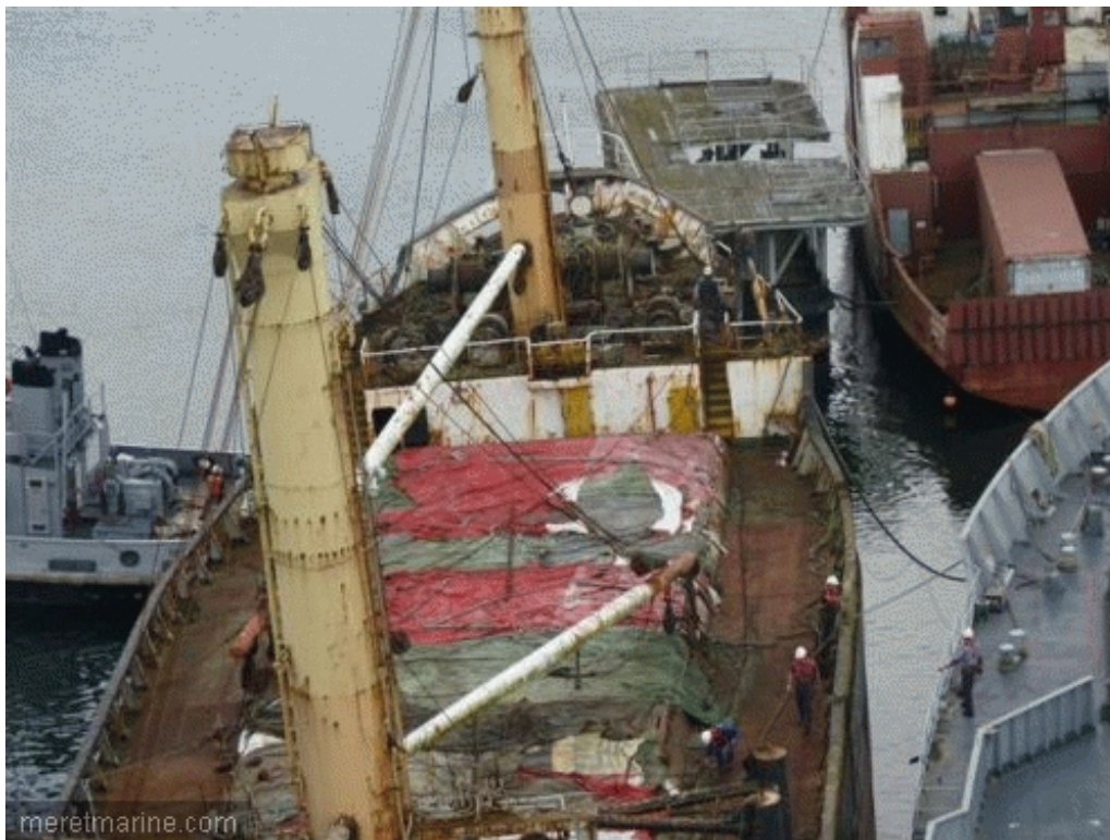
Le Winner, lundi en Penfeld