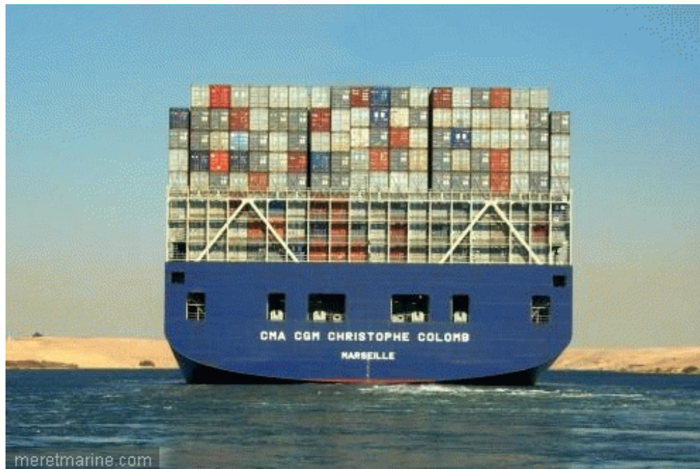
Le CMA CGM Christophe Colomb