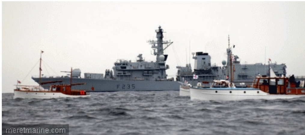
Le HMS Monmouth accompagnant les Little Ships

Chalutiers, caboteurs, yachts, voiliers... De tous les ports du sud-est de l'Angleterre, des centaines de petits bateaux, les fameux Little Ships, convergent vers Dunkerque. En tout, les Anglais parviennent à mobiliser un total de 800 bateaux, les Français rassemblant une flotte de 350 navires. Abandonnant leur matériel, les soldats encerclés embarqueront sur ces bateaux jusqu'au 4 juin dans des conditions très difficiles. Le port étant inutilisable, l'évacuation est menée à partir des plages mais l'aviation allemande, ainsi que les vedettes lance-torpilles de la Kriegsmarine, coulent de nombreux bateaux (comme le torpilleur Bourraque sur l'image ci-dessus). Malgré le harcèlement des Allemands, l'opération Dynamo sera un franc succès. En moins de 10 jours, 338.226 soldats (dont 123.095 Français) sont recueillis à Dunkerque et rapatriés à Douvres (les bâtiments français sauveront 48.000 hommes) et 4000 autres vers Le Havre et Cherbourg. La quasi-totalité du corps expéditionnaire britannique est sauvé. Il manquera une grosse journée d'opération pour évacuer le reste des troupes françaises, dont 35.000 hommes sont finalement capturés par les Allemands.