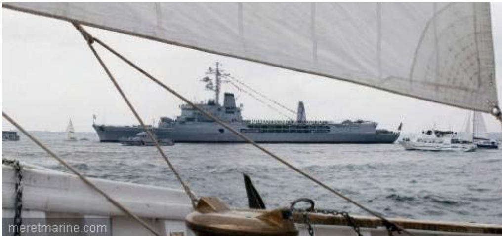
La Jeanne à Brest