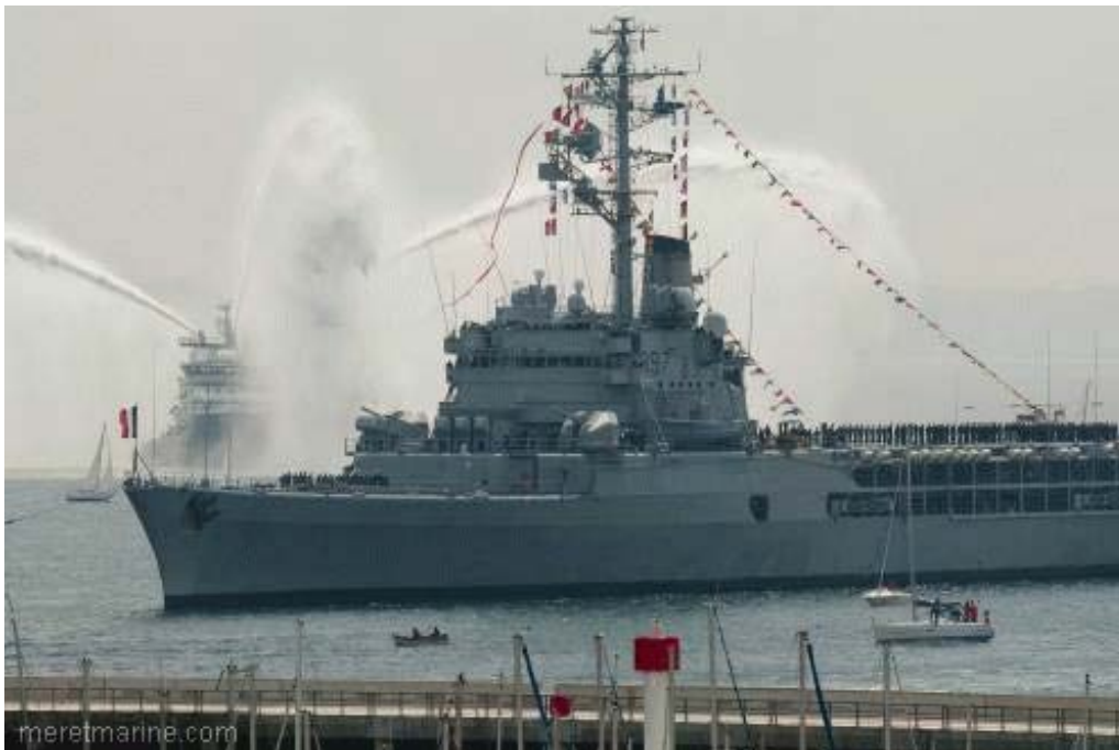
La Jeanne à Brest