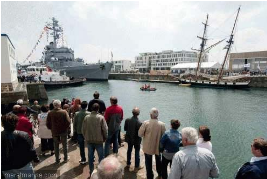
La Jeanne à Brest