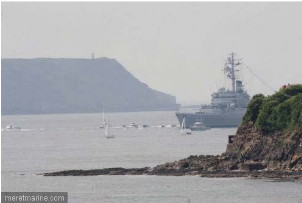
La Jeanne à Brest