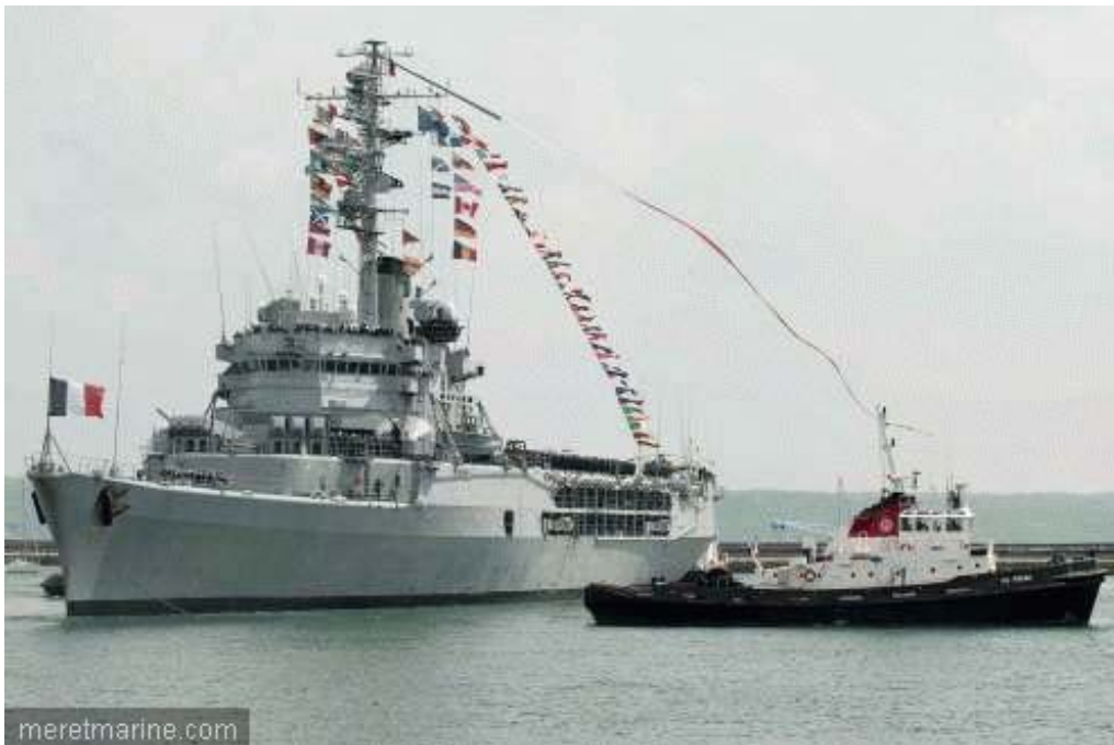
La Jeanne à Brest