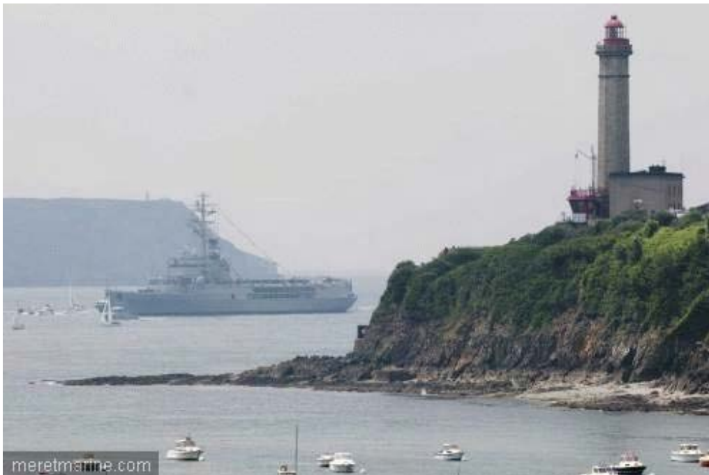
La Jeanne à Brest