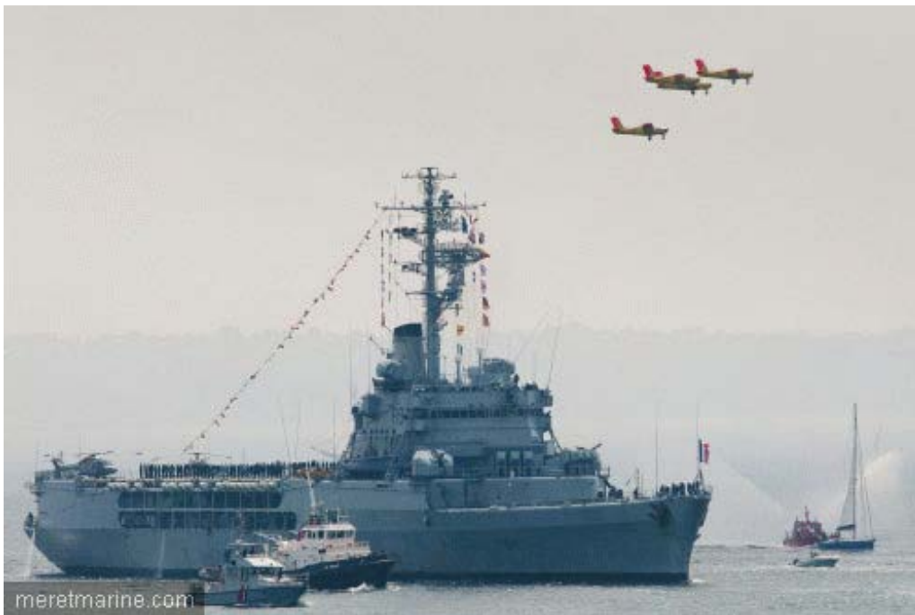
La Jeanne à Brest