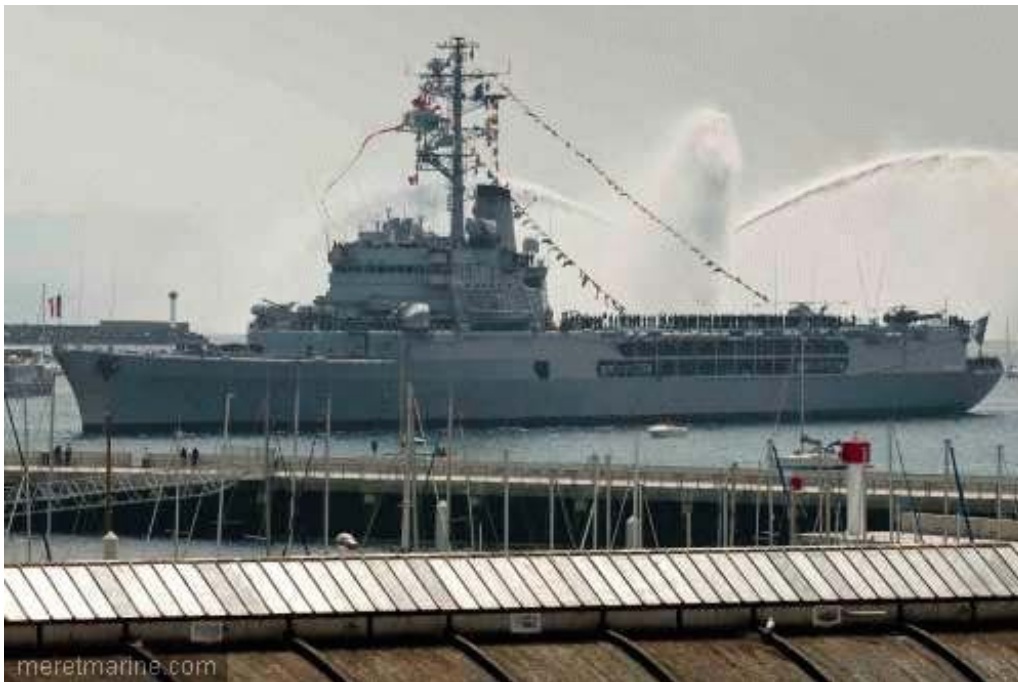
La Jeanne à Brest