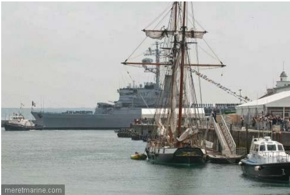
La Jeanne à Brest