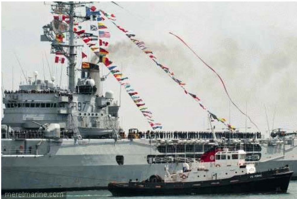
La Jeanne à Brest