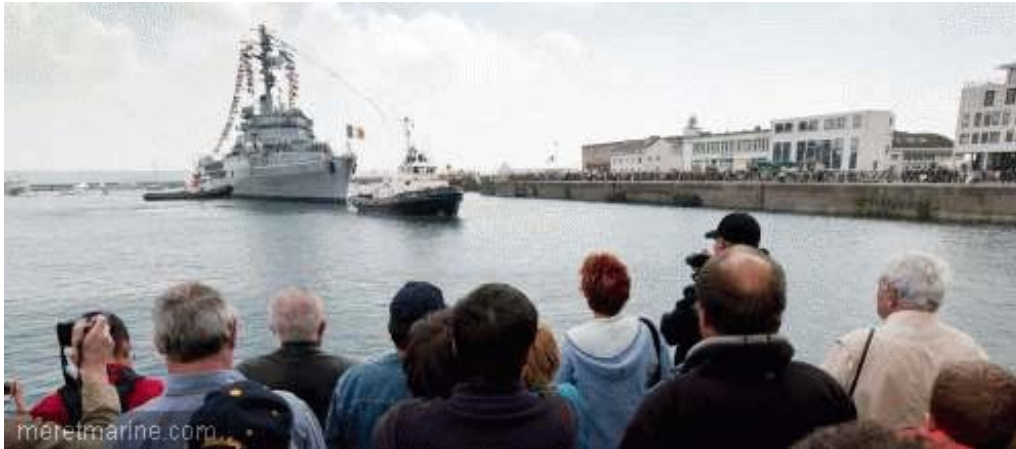
La Jeanne à Brest