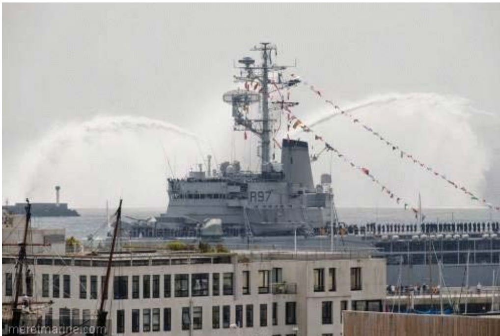
La Jeanne à Brest