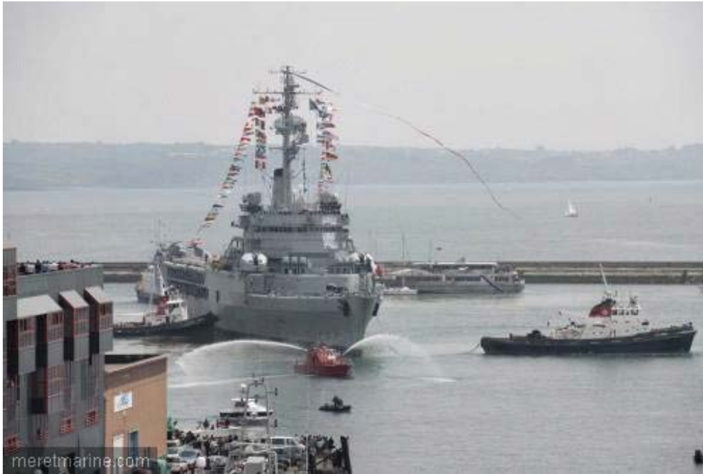
La Jeanne à Brest