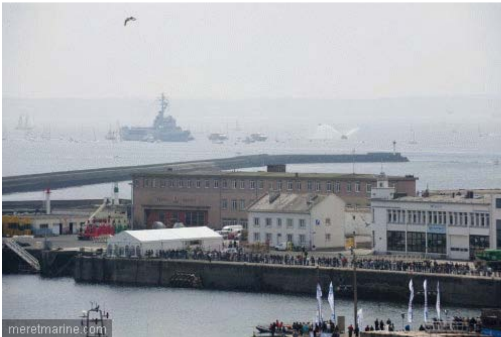
La Jeanne à Brest