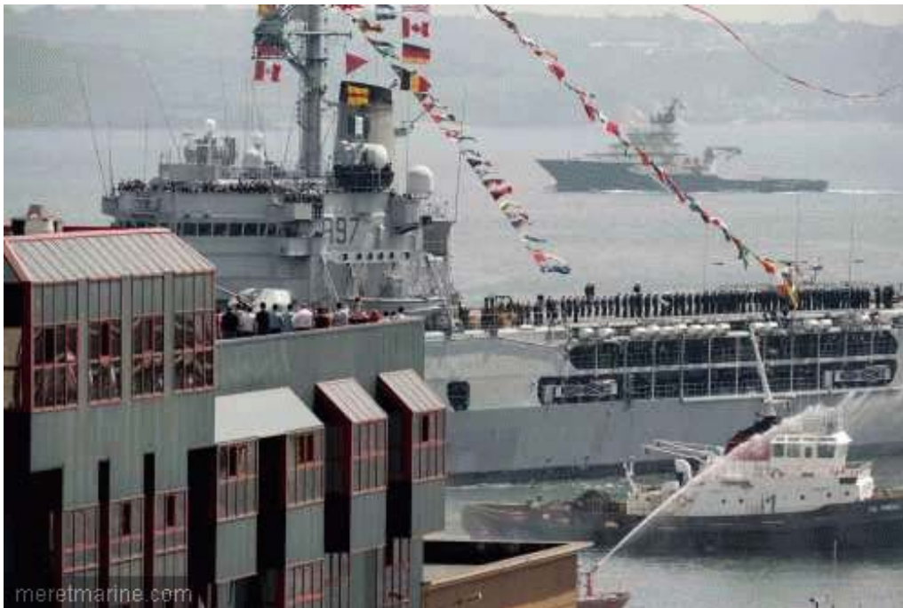
La Jeanne à Brest