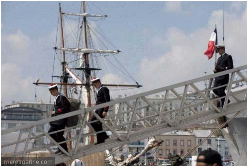
La Jeanne à Brest