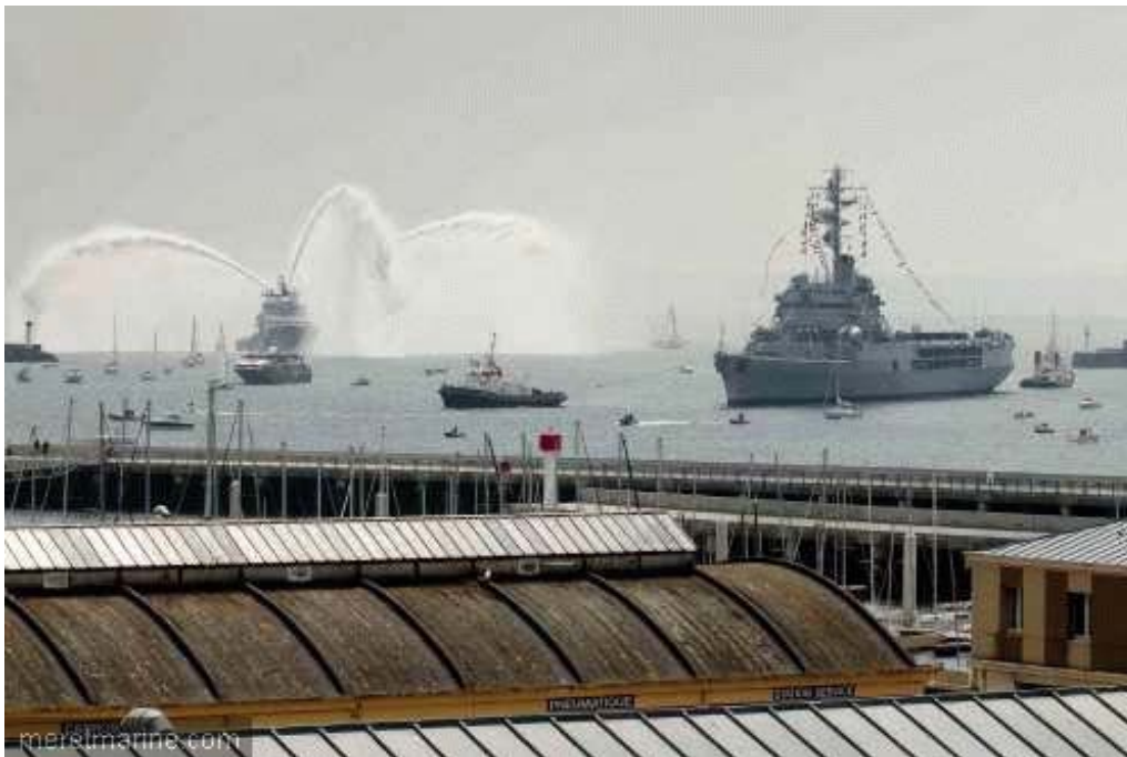
La Jeanne à Brest