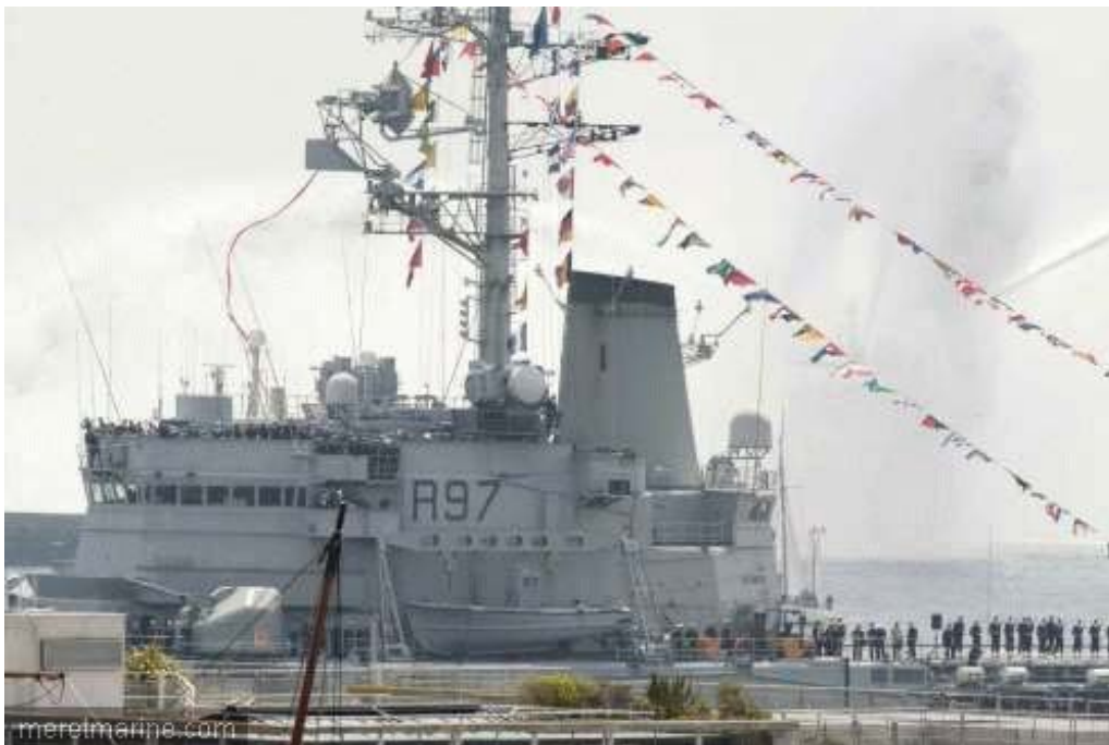
La Jeanne à Brest