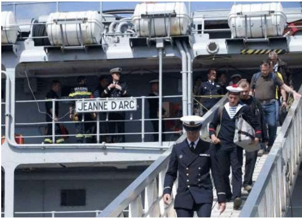
La Jeanne à Brest