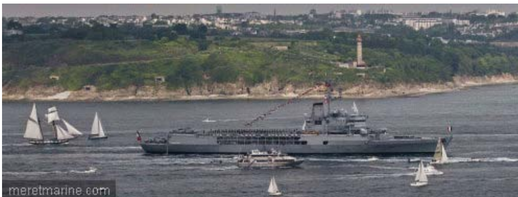
La Jeanne à Brest

Comme prévu, Brest a offert à la Jeanne d'Arc un accueil digne de son ultime retour de campagne. Arrivé en début d'après-midi dans le goulet, le célèbre bâtiment école a eu le droit à son plus beau comité d'accueil depuis sa mise en service, en 1964. Les bâtiments écoles étaient là, à commencer par les goélettes, accompagnées d'une multitude d'autres voiliers et vedettes. La Jeanne arborait une impressionnante flamme, ainsi que des dizaines de drapeaux, reflétant le caractère international de sa carrière. En quarante-six ans, le bâtiment aura, en effet, réalisé 769 escales dans 85 pays différents et parcouru 1.7 million de milles. Pas moins de 15.000 marins se sont succédé à bord, alors que 6400 élèves-officiers, français et étrangers, y ont appris leur métier.