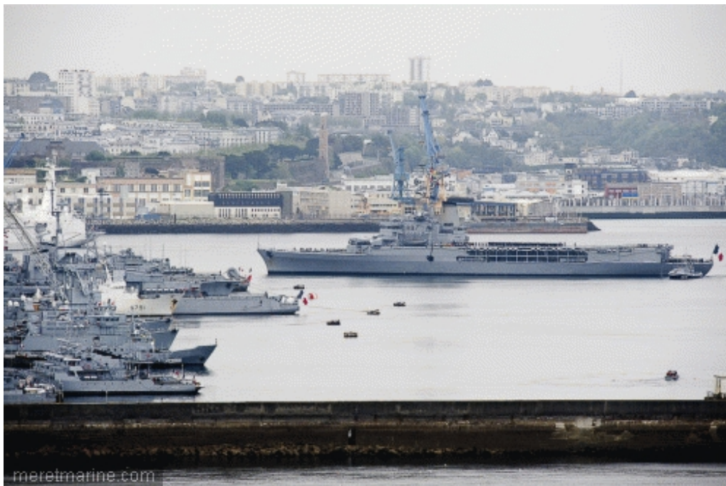
Le retour à Brest, en 2009

Après cette performance historique, la carrière opérationnelle de la Jeanne d'Arc s'achèvera aujourd'hui à Brest, où l'accueil devrait être à la hauteur de l'évènement. Le navire est attendu dans les passes à 14H. Les bâtiments écoles et voiliers de la marine l'attendront, ainsi que de nombreux autres bateaux, comme la Récouvrance ou Notre-Dame de Rumengol. La Jeanne sera également saluée, dans les airs, par un défilé aérien des hélicoptères de Lanvéoc-Poulmic. Rejoignant le port de commerce de Brest vers 15H, le porte-hélicoptères sera une dernière fois ouvert au public, ce week-end. Un feu d'artifice est même prévu samedi, à 23 heures.