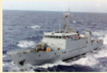
Guyane : Evacuation d'un pêcheur vénézuélien