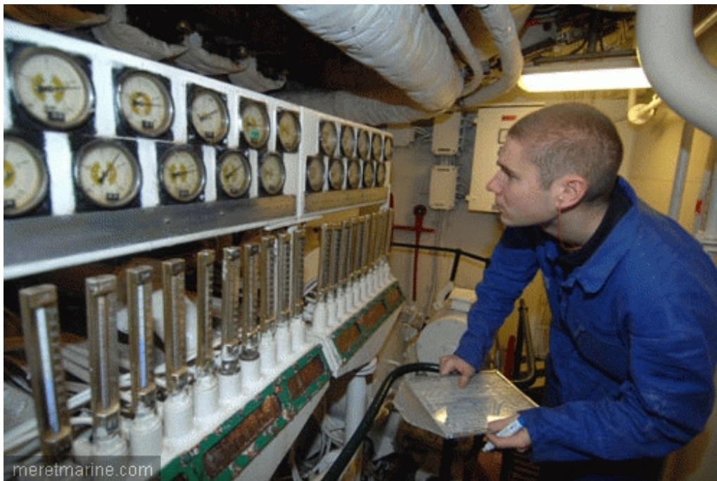
En machine avant