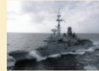
La frégate Jean Bart met le cap sur l'océan Indien