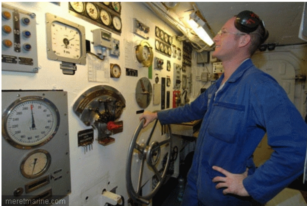
En machine avant

En avril, la montée en allure à 26 noeuds avait démontré que le vieux bateau en avait encore dans