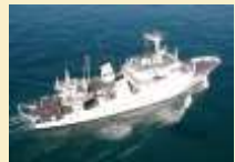
Marine nationale : Le métier d'hydrographe