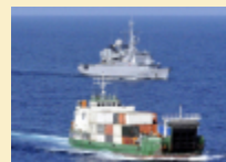
Mogadiscio : La frégate Nivose prise pour cible