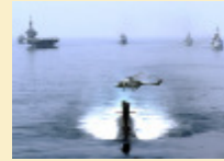
Marine nationale : La réalisation du programme RIFAN 2 notifiée