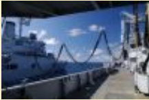
Ultime ravitaillement à la mer pour la Jeanne d'Arc