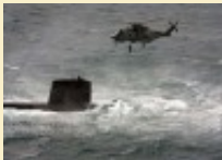
Un sous-marin français déployé avec la flotte anglaise