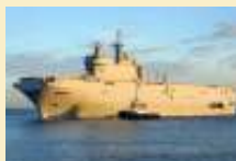
Le Tonnerre et le Georges Leygues à La Réunion