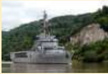
Les adieux de Rouen à la Jeanne d'Arc