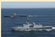
La frégate Courbet rentre à Toulon après 6 mois d'absence