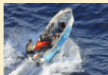
Le Nivose déjoue une nouvelle attaque de pirates