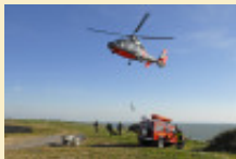
Importante opération de déminage au cap Gris Nez