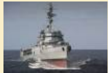
La Jeanne d'Arc va-t-elle tutoyer les 30 noeuds ?