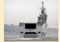
Le BPC Mistral part en Afrique de l'Ouest