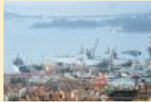
Grand nettoyage pour la rade de Toulon