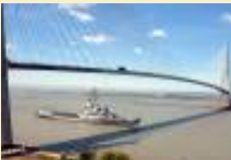
Les beaux adieux de la Normandie à la Jeanne d'Arc