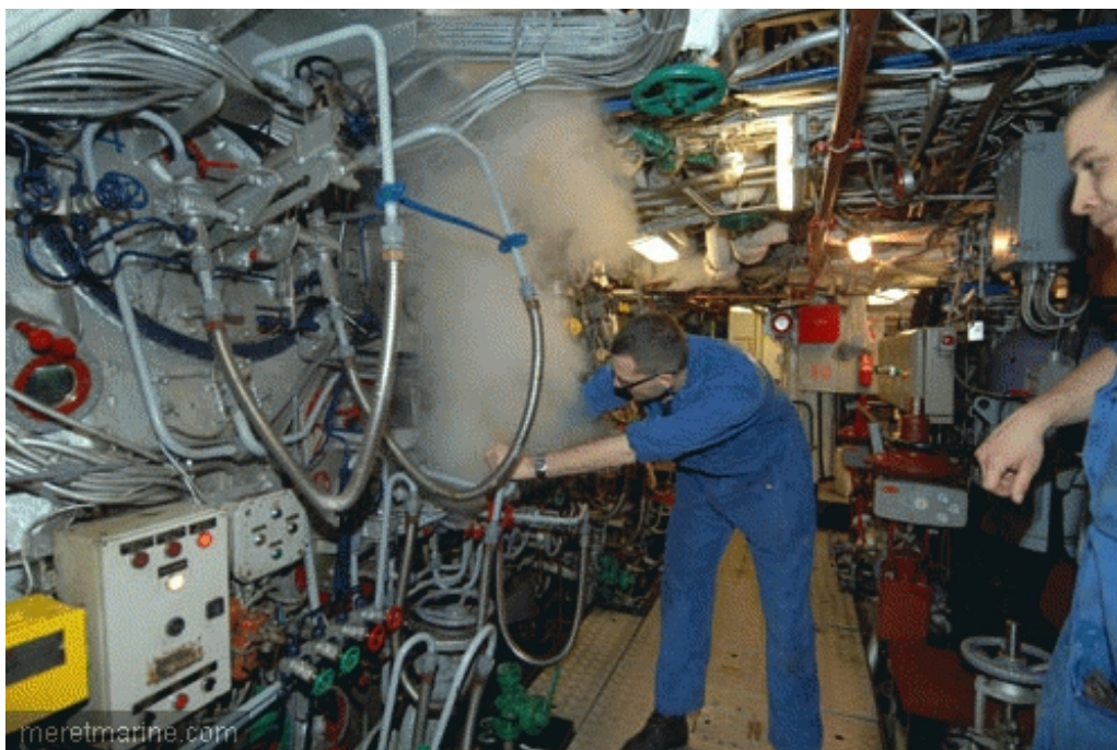
En machine avant

Pour son ultime montée en allure, le porte-hélicoptères Jeanne d'Arc a établi son record de vitesse au large du Cotentin. Légèrement aidée par le courant du Raz Blanchard, qui n'a finalement pas été très fort, la vieille dame a atteint, dans la nuit de mardi à mercredi, la vitesse de 30.9 noeuds (au GPS) et 29.4 noeuds (au loch). Quarante-six ans après sa mise en service, la Jeanne fait mieux que les 27 noeuds de son neuvage et offre à son équipage une superbe fin de campagne, la dernière avant son retour à Brest et son désarmement. A l'issue d'une préparation méticuleuse, les machines avant et arrière ont donné, comme on dit, « tout ce qu'elles avaient ». Alors que les quatre chaudières, baptisées Eglantine, Mirabelle, Clara et Morgane, brulaient furieusement le gasoil injecté par les brûleurs, à plus de 240 tours par minute, les deux lignes d'arbres brassaient les eaux sombres de la Manche. Avec ses 40.000 cv sous la carène, le vénérable bâtiment a fendu l'eau à pleine puissance, faisant vibrer ses entrailles et, bien évidemment, les coeurs de ses marins.