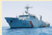
Affaires maritimes et Marine nationale surveillent la pêche au thon rouge