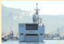
Le Mistral en route pour la 103ème mission Corymbe