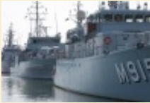
L'OTAN en opération de déminage devant les côtes françaises