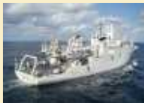
Hydrographie : Arrangement administratif franco-bénois

Le GEAOM engagé dans l'European Cadet Training (11/05/2010)