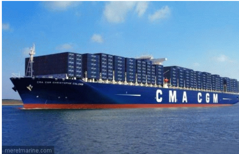
Le CMA CGM Christophe Colomb